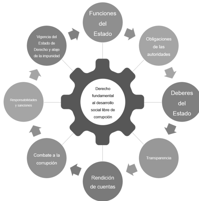
Ciclo de configuración del derecho fundamental al desarrollo social libre de corrupción