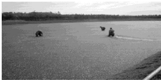
Trabajadores enviados en 39 años = 261,265

Como se mencionó en líneas precedentes, la cifra de los jornaleros mexicanos que trabajan en las distintas provincias de Canadá, ha tenido un crecimiento exponencial, como lo demuestra la siguiente estadística: