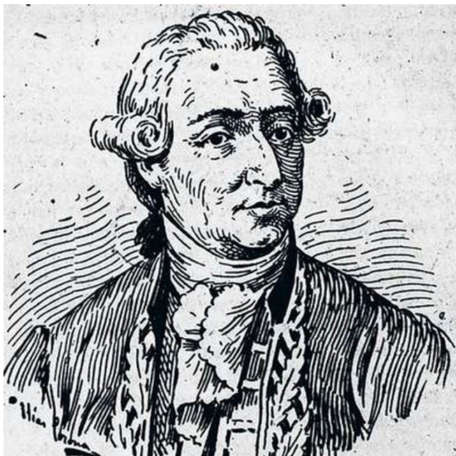
Imagen 5. Francisco Xavier de Balmis y Berenguer

Las reales mazas todavía se usaban hacia 1864, cuando en un bando de fecha 18 de mayo —emitido por el prefecto municipal de Zacatecas para solemnizar la recepción de la noticia de la llegada de Maximiliano de Habsburgo al puerto de Veracruz—, se disponía saliera el ayuntamiento desfilando con los maceros. 29