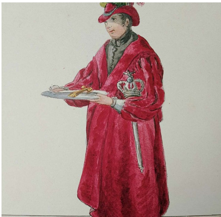
Imagen 4. Macero de la ciudad de México (1810-1827)

FUENTE: Biblioteca Nacional de Madrid. Patrimonio Nacional. Sig. Grab 261.